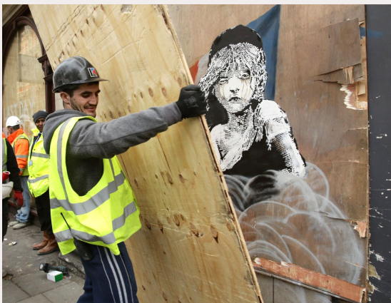
Un hombre cubre hoy con un tablón de madera el grafiti de Banksy

http://cultura.elpais.com/cultura/2016/01/25/actualidad/1453714164_325373.html